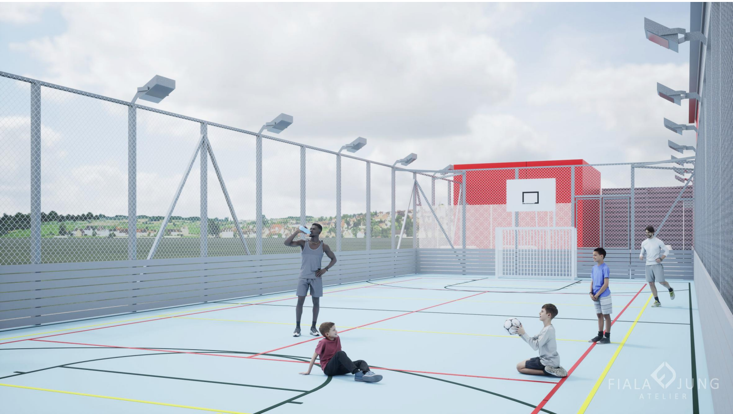
DENNÍ POHLED ZE HŘIŠTĚ